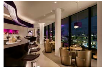
The Bridge Bar

Hamburg – 30. November 2016 – Westin Hotels & Resorts, ein Teil von Marriott International, gibt heute die offizielle Eröffnung des Westin Hamburg bekannt – und damit zugleich das Debüt der beliebten Hotelmarke mit Wellnessfokus in Deutschlands Hansestadt. Das Hotel befindet sich in der Elbphilharmonie, Hamburgs neuem Wahrzeichen, einer perfekten architektonischen Symbiose aus historischem Kaispeichergebäude und markanter Glasfassade, das außerdem zwei Konzertsäle sowie Eigentumswohnungen beherbergt. Entworfen wurde das beeindruckende Gebäude vom renommierten Schweizer Architekturbüro Herzog & de Meuron. Von der exponierten Lage in der Speicherstadt – vor kurzem zum UNESCO Weltkulturerbe ernannt – sind es nur wenige Schritte zu den vielfältigen kulturellen, vergnüglichen und historischen Attraktionen der Stadt.